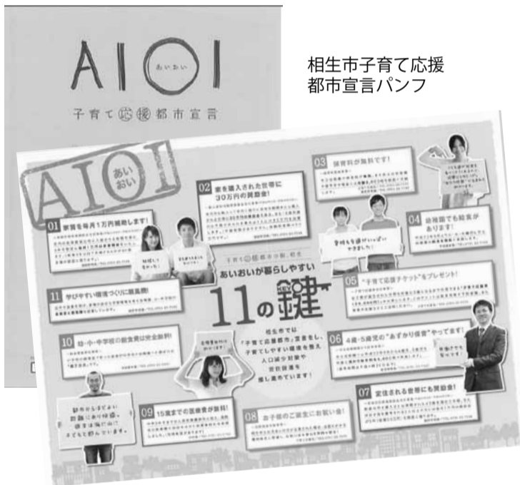
相生市子育て応援都市宣言パンフ

西宮市では、中学校給食は50年前から実施しています。西宮市の教師に聞くと、「西宮は中学校でも給食があるから」と転入してくる保護者が多くいるということです。西宮市では、中学校卒業までの医療費の無料化も阪神間でいち早く実施しています。 西宮市は阪神大震災から人口が10万人増えていますがその背景には、子育て支援の充実があると考えられます。 相生市では、「子育て応援都市宣言」をし、幼稚園から中学校まで学校給食費の無料、子どもの医療費の無料化、保育料の軽減事業等「あいおいが暮らしやすい、11の鍵」をすすめています。 子育て支援を「まちづくり」の中心にしています。子育て世帯の市外への流出が目立っている尼崎市にとって、若い世代の定着をめざす「子育て支援策」は待ったなしの課題です。