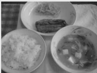
西宮市の中学校給食